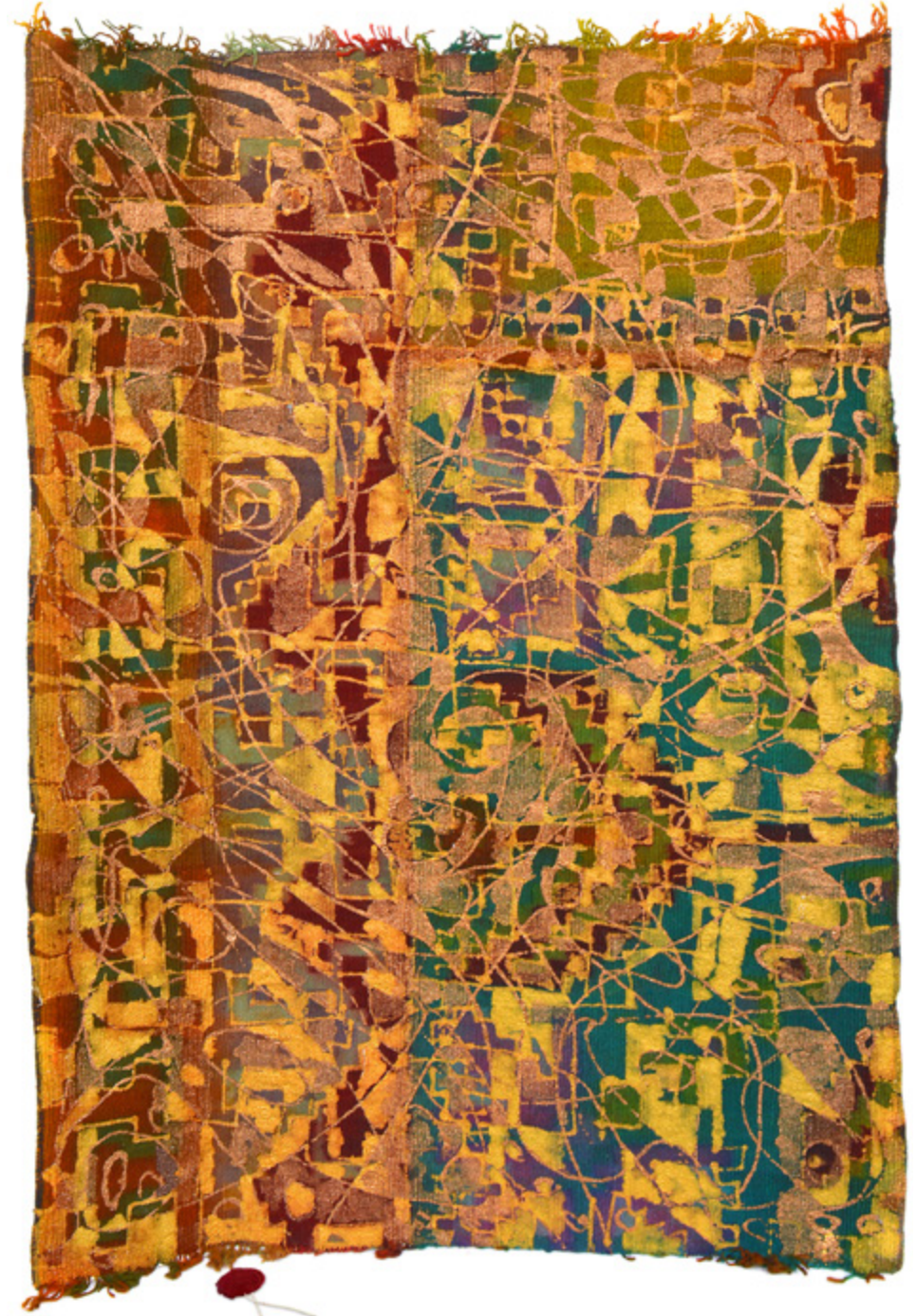
Bruitages Ben Ounais • Acrylique sur mergoum • 72 x 101 cm

رحلة بها جدال و جدليّة بين اسماك مشقّرة خاصة الأسلوب. توليفة بين مرقوم كمحمل سجّاد ولوحة تشكيلية معاصرة في صندوق من "Plexi Glass"، مفتوحة وقابلة لإخراج في تصوّرات جديدة تساهم في توثيق التّراث والمحافضة عليه والإهتمام به فنيّا وجماليا.