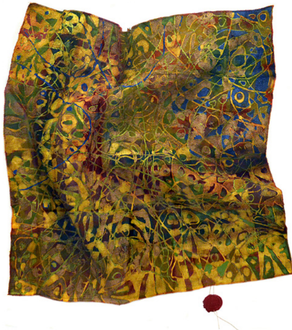
Bourdonnement Bouzidi • Acrylique sur mergoum • 100 x 100 cm