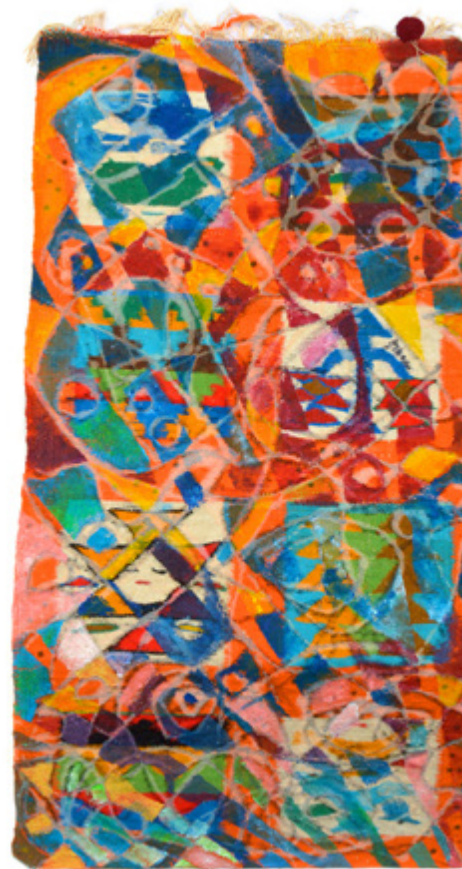
Frissons Zalouch Acrylique sur mergoum • 53 x 100 cm