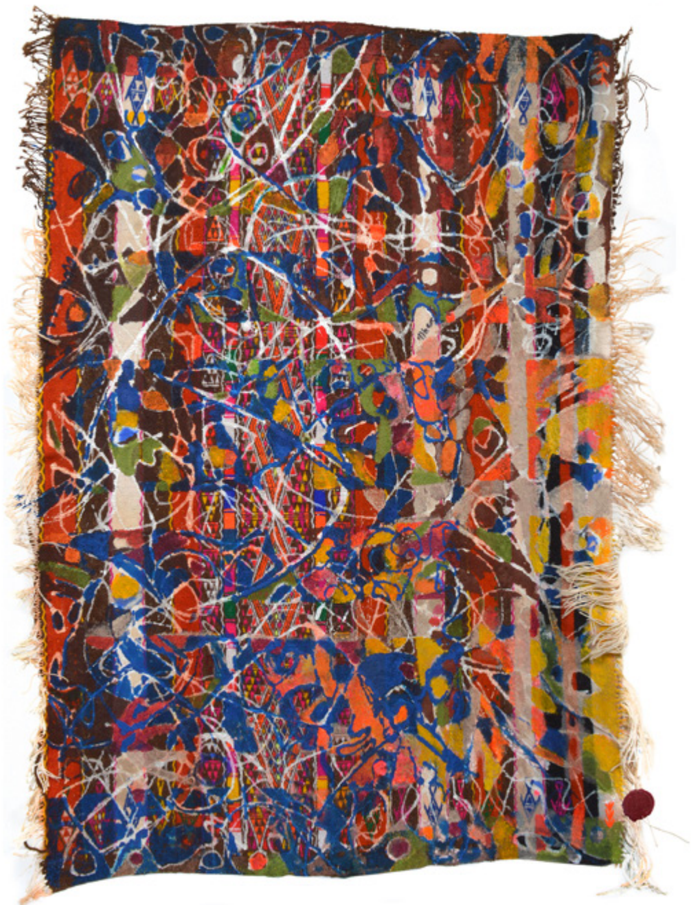
Élucubrations Jbéniennoises • Acrylique sur mergoum • 90 x 105 cm