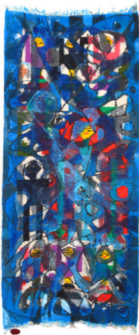
Chuchotage Snad Acrylique sur mergoum • 43 x 100 cm

«ان كل شيء قابل ان يكون عملا تشكيليا ضمن مبادئ تحويل وجهة الشيء» مارسيل ديشان - Marcel Duchamp