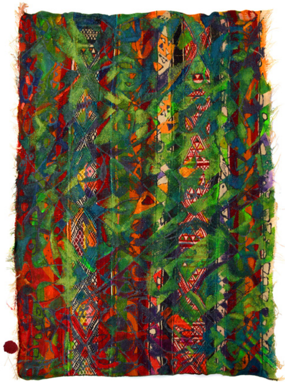
Susurement Midoun • Acrylique sur mergoum • 78 x 108 cm