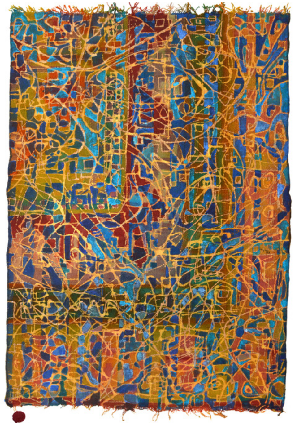
Frémissements Amazigh • Acrylique sur mergoum • 84 x 119 cm

Dans les œuvres d'Ilhem, on entend des marmonnements, des murmures, des résonances de toute sorte et même des révélations assourdissantes. Dans ses œuvres, on assiste à des affrontements et des luttes lorsque le silence de la trame du fond refuse toutes accointances avec le pinceau, ou encore lorsque la matière s'entête et impose sa texture à la couleur... Dans ses œuvres, il y a de la vie, il y a de l'âme... Et puis, on ressent une légèreté, une élévation... comme une secousse nécessaire à tout éclatement, à toute naissance... Serai-elles les prémices d'une approche plastique inédite !?