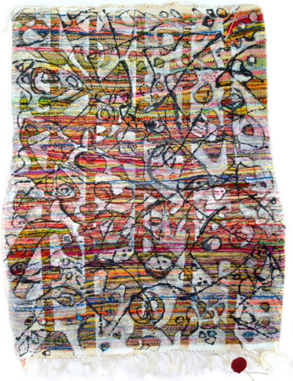
Bavardage Kasserinois • Acrylique sur mergoum • 71 x 114 cm