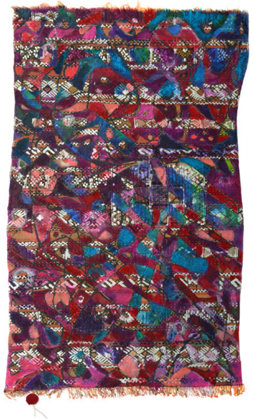
Tranquilité Chnoise • Acrylique sur mergoum • 63 x 105 cm

حياكة حرفيّة وحكاية تصويريّة على محملٍ طبق مُوشّح في حفل تشكيلي!