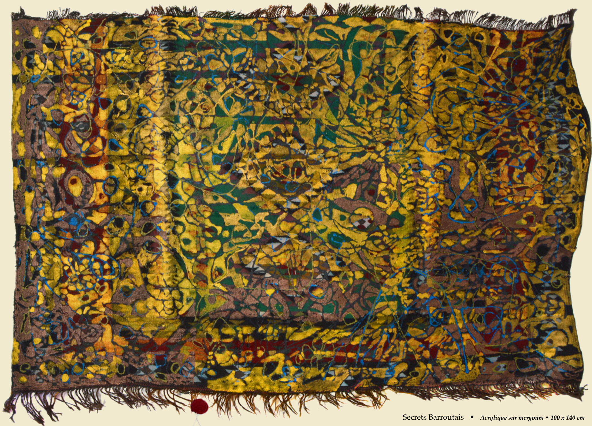
Secrets Barroutais • Acrylique sur mergoum • 100 x 140 cm