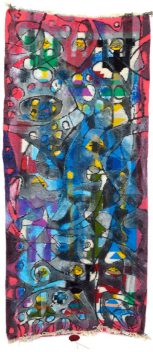
Chuchotis Sidi Aïch Acrylique sur mergoum • 43 x 100 cm