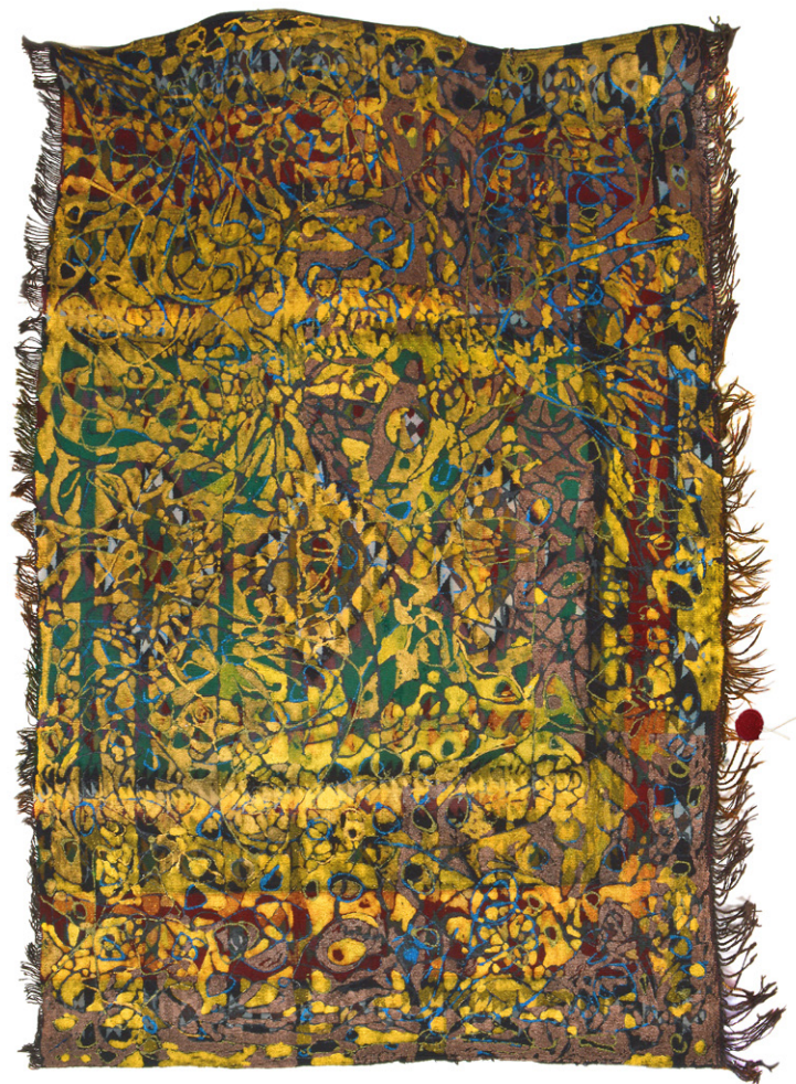
Au grès du temps • 110x156cm - Acrylique sur margoum