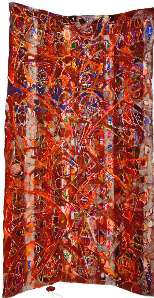
Trames du temps • 115,5x90cm - Acrylique sur margoum