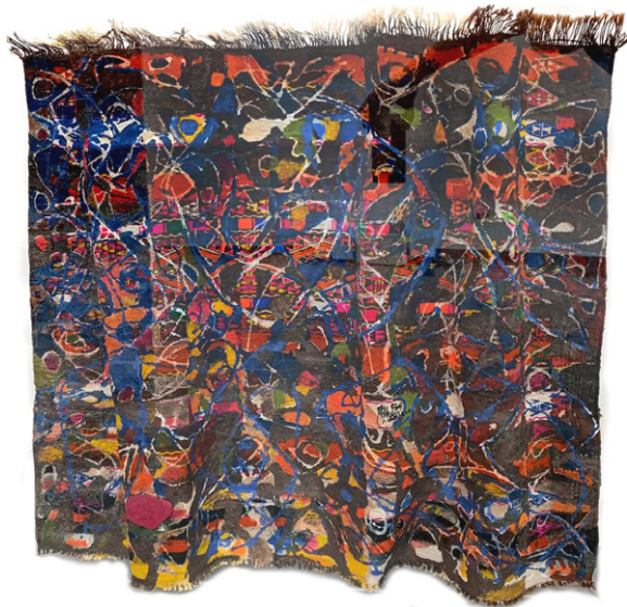
Visible et invisible • 90x94cm - Acrylique sur margoum