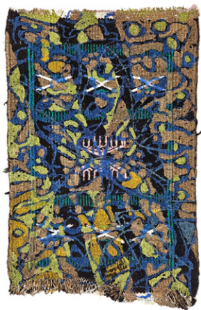
Passé recomposé 1 • 47x34cm Acrylique sur margoum