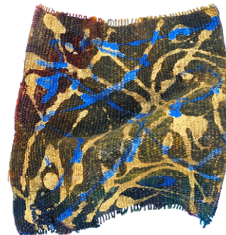
Identité 1/2 • 20x20cm Acrylique sur margoum