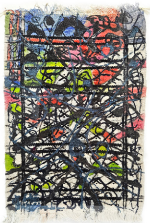
Passé recomposé 2 • 47x35cm Acrylique sur margoum