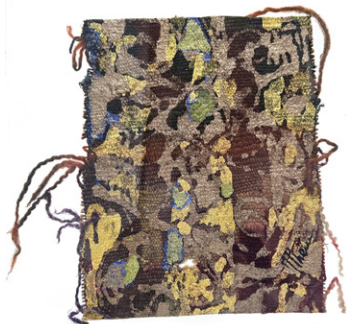
Auratique 1/2 • 30x30cm Acrylique sur margoum