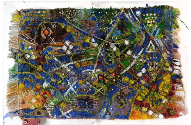
Authenticité - 60x38cm - Acrylique sur margoum

Loin d'être un simple exercice de style, le dialogue intemporel que l'artiste instaure entre le Margoum et la peinture revêt une dimension profonde. Ilhem affirme que ces deux univers artistiques distincts sont bel et bien complémentaires, qu'ils possèdent le pouvoir de s'enrichir mutuellement