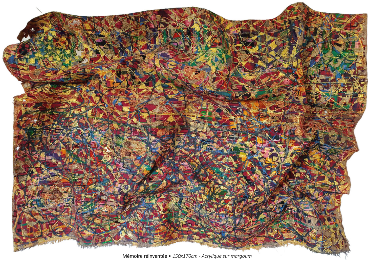
Mémoire réinventée • 150x170cm - Acrylique sur margoum