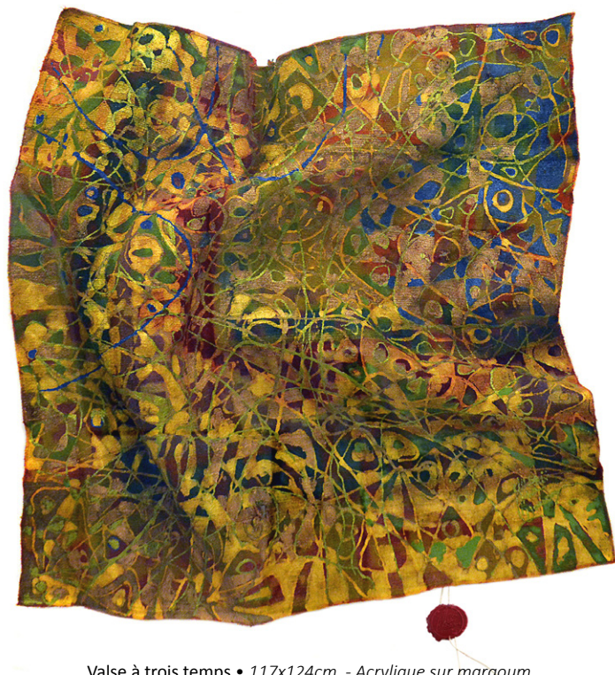
Valse à trois temps • 117x124cm - Acrylique sur margoum