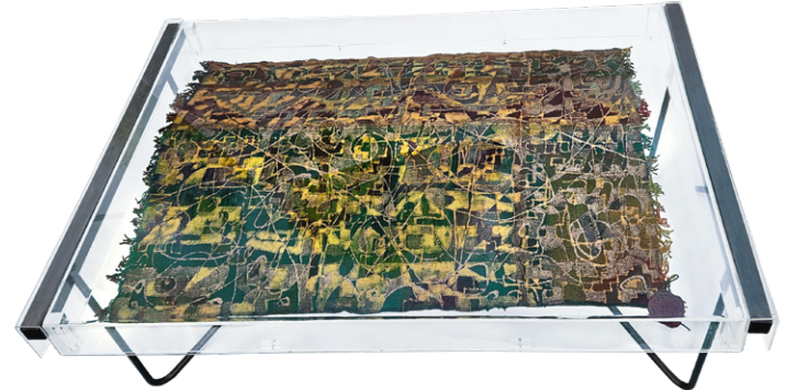
Jardin du passé • 73x110,5x40cm (Table basse) - Acrylique sur margoum