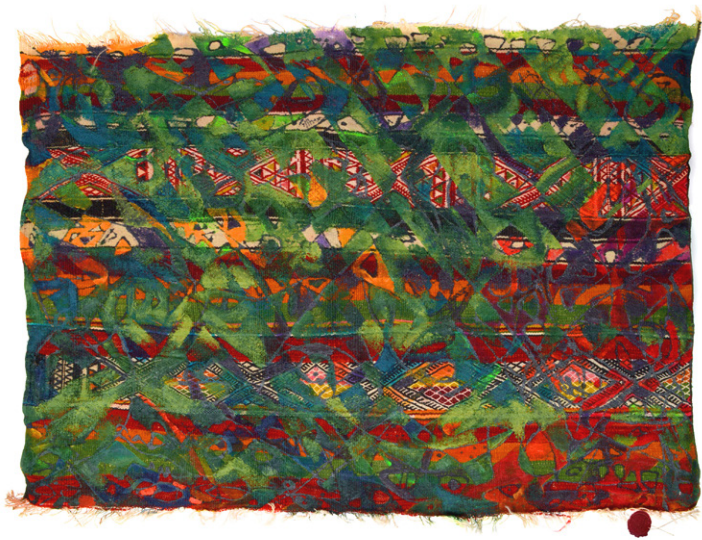
Vieille légende • 84x128cm - Acrylique sur margoum