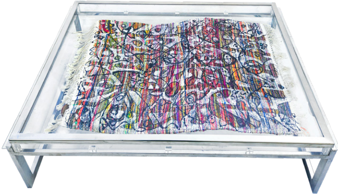
Dialogue intemporel • 130x91x40cm (Table basse) - Acrylique sur margoum

وأثناء التفكير في هذا السير/ الرحلة التي لا تزال متواصلة، لا يمكن إلا أن نعتبر الرّحلات الجديدة التي بدأت منذ سبعينات القرن الماضي مواصلة وتواصلا للحوار مع هذه الأرقام الموقّعة والواقعة وقعا جميلا، عند الفئانة إلهام سباعي التي أبت إلا أن تندمج في هذا الحوار الجميل مع ما يوفّره الحامل المرفوم من نسج ليصبح حاملا لتجربة جديدة ومتجدّدة، يوفّرها التكرار المفرد الذي تحدّث عنه الفلاسفة القدامى والمحدثين. وهو حركة خفية رغم تظّهرها كلّ يوم. هو أصل الحركة