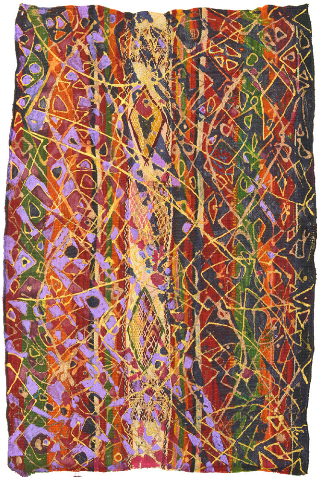
Les fils du temps • 113.5x74cm - Acrylique sur margoum