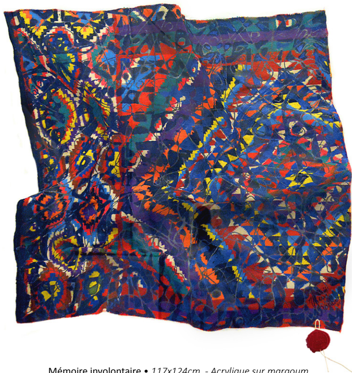
Mémoire involontaire • 117x124cm - Acrylique sur margoum