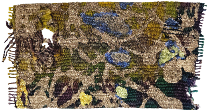
Symphonie 1 • 20x15cm - Acrylique sur margoum