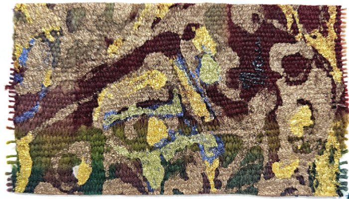
Symphonie 2 • 20x15cm - Acrylique sur margoum