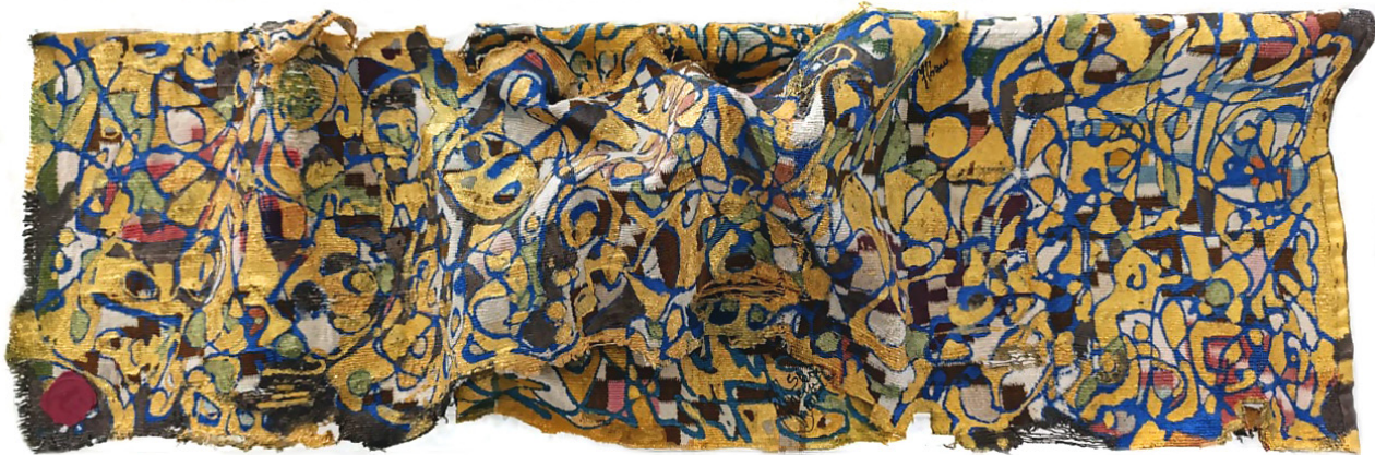
Conversation 2.0 • 40x120x90cm (Stella) - Acrylique sur margoum