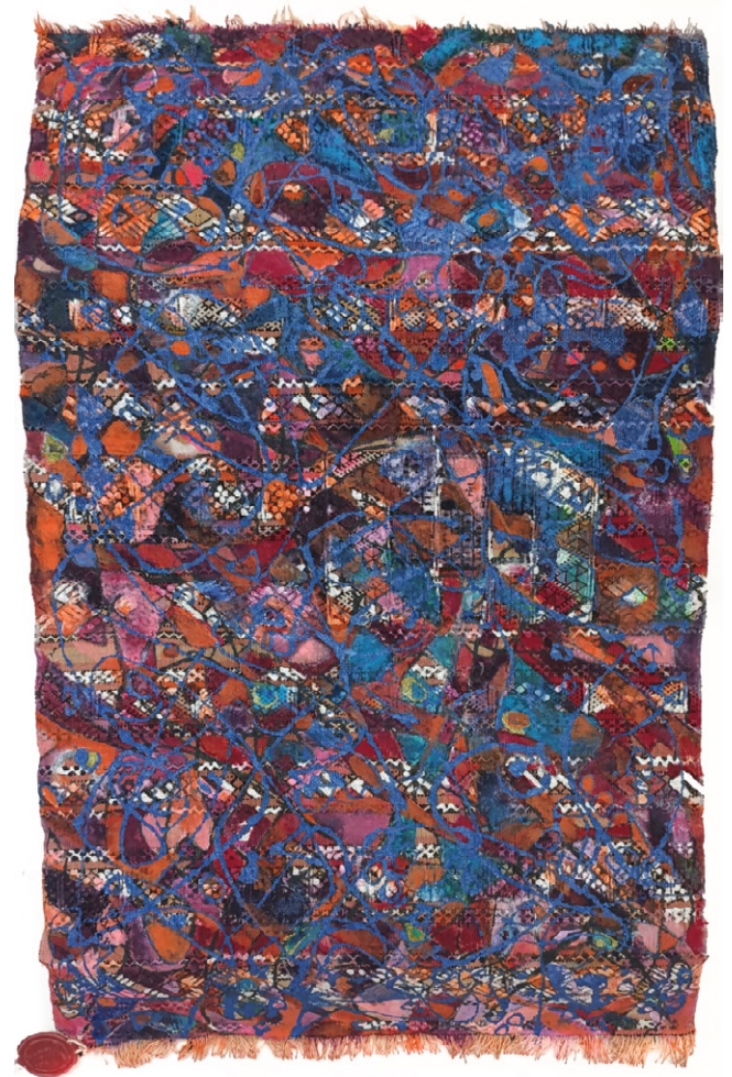
Au delà du réel • 122,5x73,5cm - Acrylique sur margoum

3 ème prix aux Journées d'Art Contemporain de Carthage édition 2023 et participation confirmée à la 2 ème édition de 2021 avec une installation conceptuelle contemporaine WEIGHT-SOUNDS ELECTIONAL, et pour couronner le tout, en septembre 2023, Exposition Eco-Contemporaine - Change To ECO- BIAF2023 ; participation à des journées culturelles au siège de l'Organisation Mondiale de la Propriété Intellectuelle à Genève OMPI ; Août 2023, journées régionales d'art contemporain de Carthage - Médenine/Djerba-Monastir-Bizerte. Commissaire d'événements artistiques à l'établissement secondaire Les Pères Blancs, de 2018 à aujourd'hui. En mai 2023, elle acquiert les 1 er et 2 ème prix Junk Kouture édition tunisienne Envirofest et sélection pour le concours international de Londres.