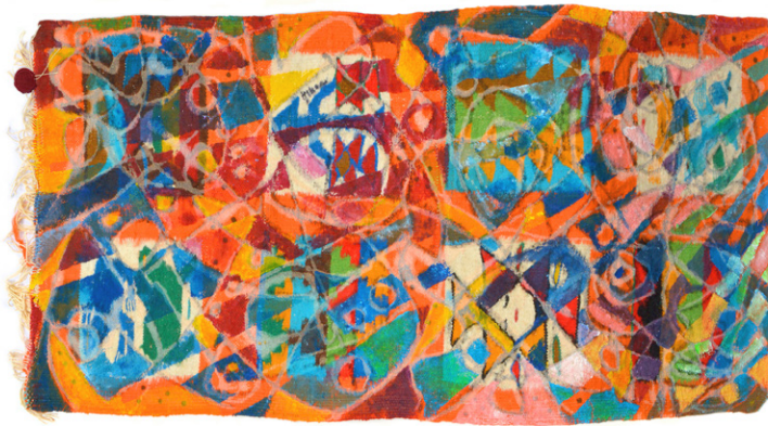
Orange mécanique • 113x51cm - Acrylique sur margoum